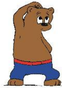
Wat moet ik doen?

We starten in de 3 de kleuterklas met de beertjes van meichenbaum. Met deze vier stappen (4 beren) leren de kleuters een goede werkhouding en leren ze goed taakgericht te werken.