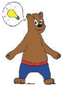
Hoe ga ik het doen?