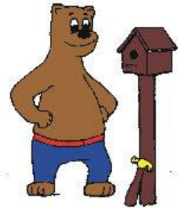
Ik kijk mijn werk na. Wat vind ik ervan?