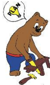
Ik doe mijn werk